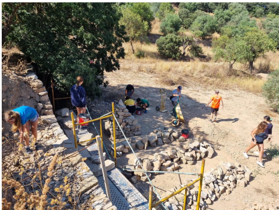
Fotos camps de treball

L'entitat gestora del camp de treball té les assegurances de responsabilitat civil i d'accidents que marca la llei.